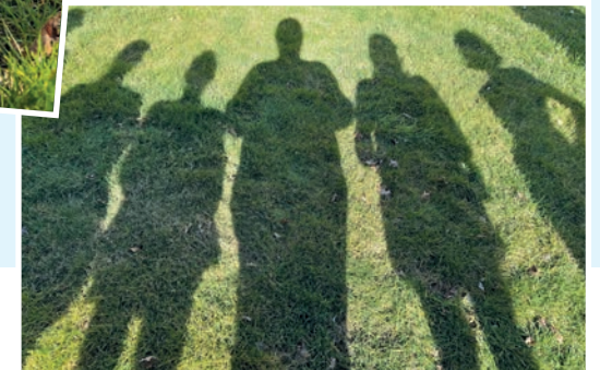
... ohne Ansehen der Person