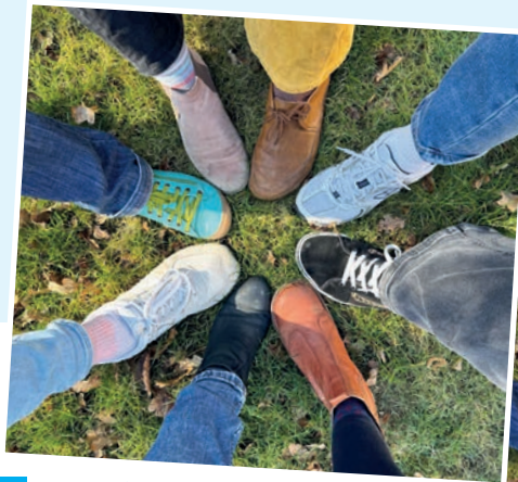
... wenn es Nähe braucht