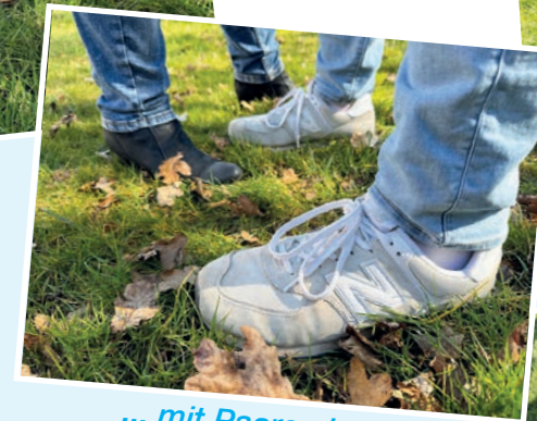
... mit Paaren in der Paarberatung