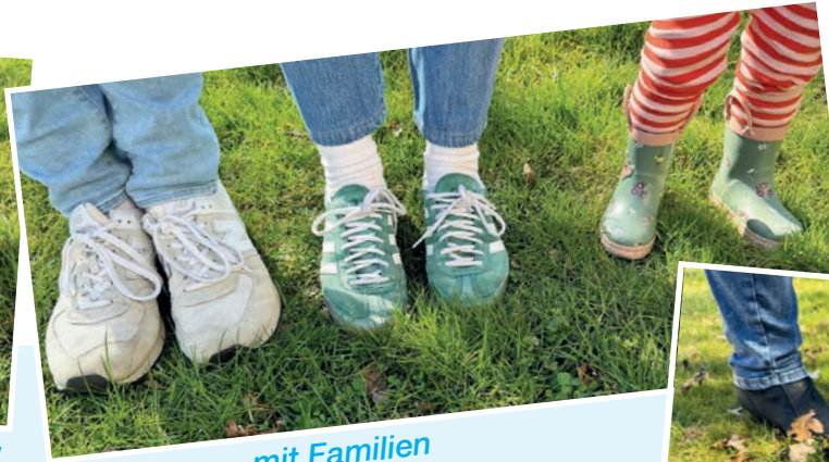
... mit Familien