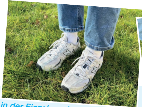
... in der Einzel- und Lebensberatung