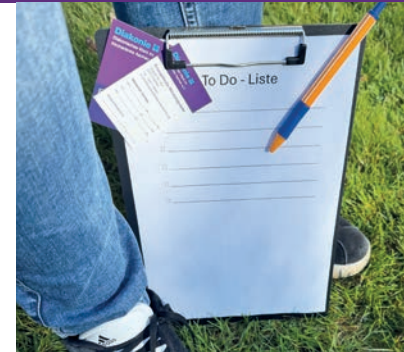
... mit KlientInnen in sozialen Notlagen