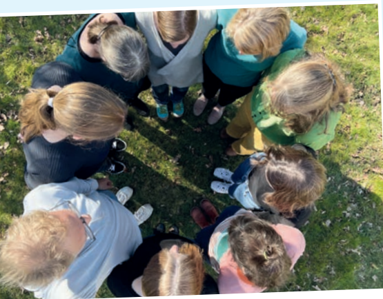
... als Team