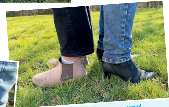
... in der Trennungs- und Umgangsberatung