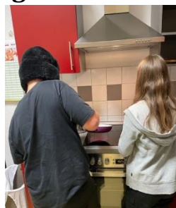
Teamwork im Feuervogel

Auf den Wunsch einiger Kinder nutzten wir die Gruppenarbeit bis zu den Sommerferien, um gemeinsam zu kochen und zu backen. Um die Kinder partizipativ einzubinden wurden ihre Wunschrezepte im Vorfeld gesammelt und einige Zutaten eingekauft. Dann hieß es „Schürzen an- und los“.