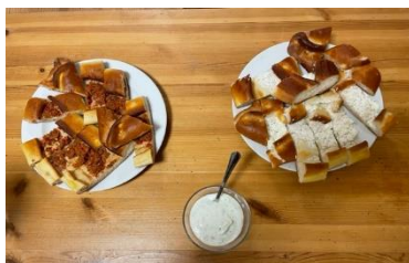
Pide mit verschiedenen Füllungen und selbstgemachtem Tzatziki