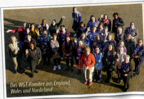
Das WGT-Komitee aus England, Wales und Nordirland